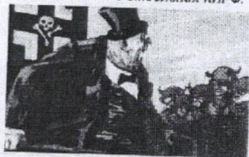
Буржуй СИДОРОВ горло перегрызет за деньги.